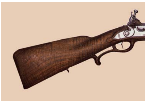
Um 1720: Jagdgewehr Deutschland

Abgewandelter französischer Schaft mit Abzugsbügel aus Holz, genannt Kapuzinerschaft