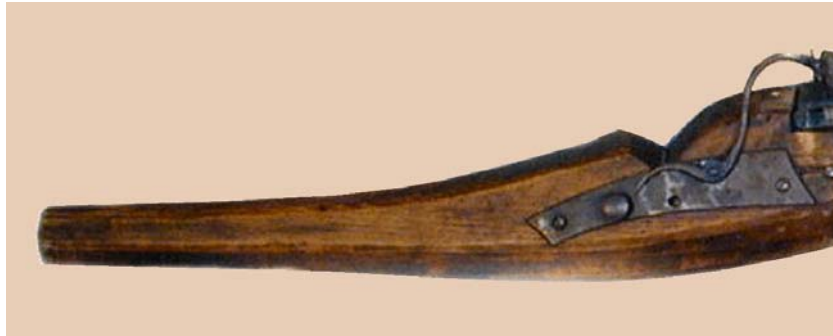
Abb. 11 – 22

Die grossen Hakenbüchsen, oft auch Doppelhaken genannt, wurden vorne auf der Brüstung der Befestigung aufgestützt und hinten vom Schützen mit beiden Händen gehalten und auf das Ziel gerichtet. Eine spezielle Schaffform mit stielähnlichem, langem, oft achtkantigem Ende hat sich dazu speziell geeignet.