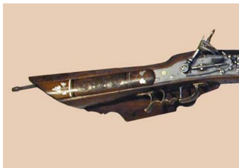
Abb. 11 – 38

Bayerisches Nationalmuseum, München