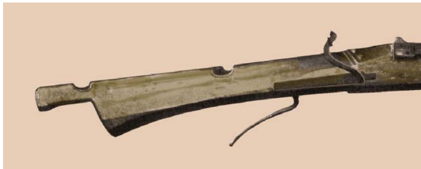
Abb. 11 – 24

Schweizerisches Landesmuseum, Zürich; Bildquelle: Schu2