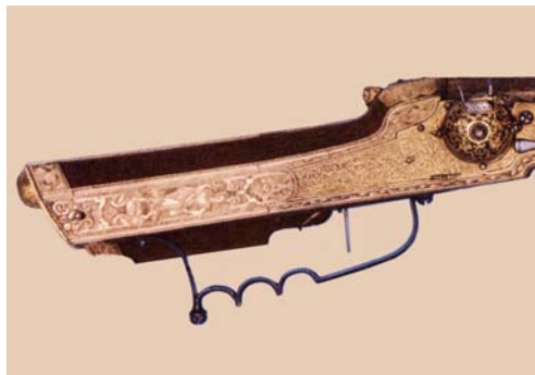
Abb. 11 – 37