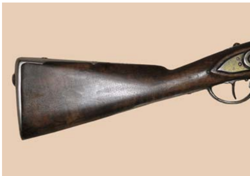
Um 1754: Infanteriegewehr M. 1754 Österreich