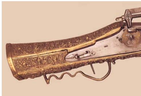
Abb. 11 – 36

Bayrisches Museum, München