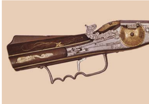
Abb. 11 – 35

In der mittel- bis süddeutschen Gegend ist ein Jagdschäft entstanden, der sich durch eine untere, plattenartige Verbreiterung auszeichnet.