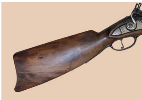
Um 1720: Steinschlossgewehr Zeughaus Zürich Schweiz