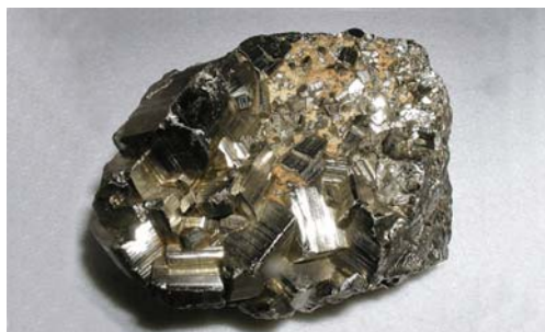
Abb. 4 – 13

Pyrit, Schwefelkies in seiner natürlichen Form