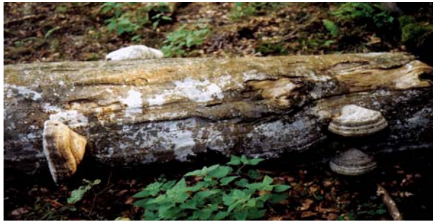
Abb. 4 – 11