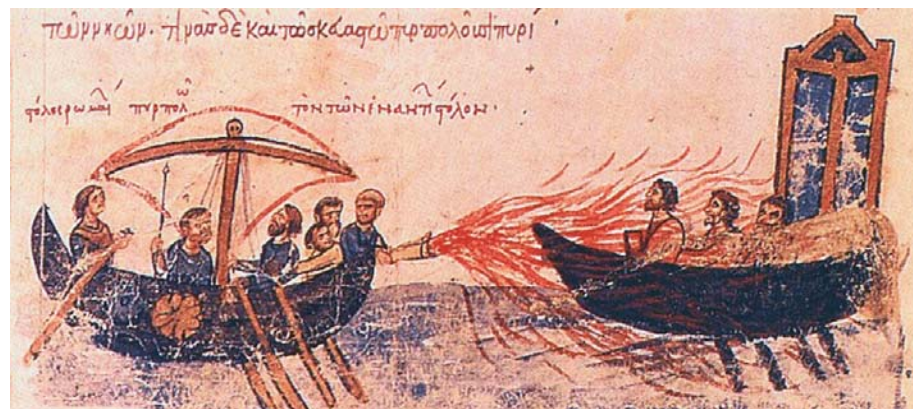
Griechisches Feuer. Einzige bekannte Darstellung aus dem 12. Jh.