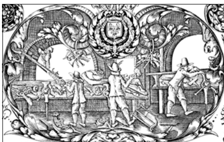
C. Jacquinet, 1660, Paris