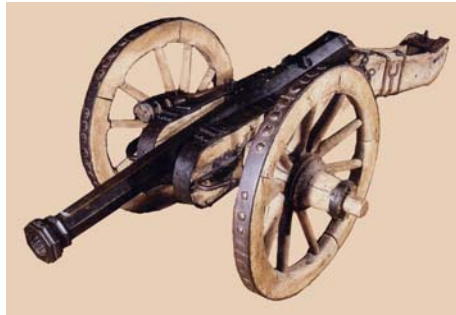
Abb 2 – 29

Schloss Hohenklingen, Stein am Rhein