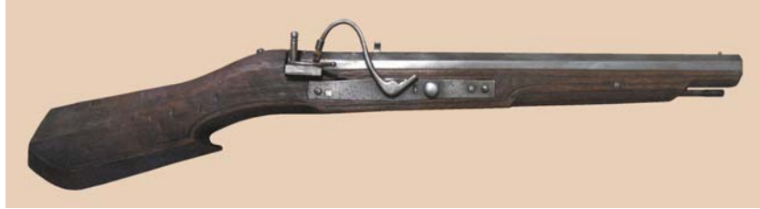
Abb. 2 – 28

Waffenlänge: 805 mm Lauflänge: 505 mm Kaliber: 18 mm