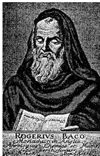
Abb. 2 – 1a